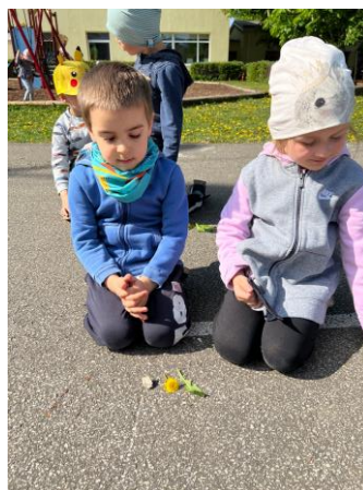
Kevadine matk ja piknik metsa all